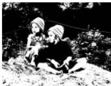
Po nastěhování první pečovatelské rodiny v létě 2003 začal camphill v Českých Kopistech ožít