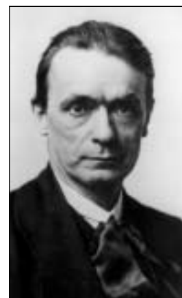
Zakladatelem byl Rudolf Steiner

S biodynamickým zemědělstvím se stále setkáváme a málo mu rozumíme – proto je mu věnována samostatná kapitola