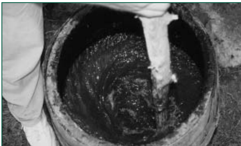
Míchání biodynamického preparátu roháčku

Před inseminací se dává přednost přirozené plemenitbě. V plemenářské práci se klade důraz na dlouhověkost a celoživotní užitkovost.