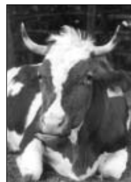
Rohaté krávy – do budoucna pouze výsada biodynamických statků?

Velký význam je připisován péči lidí o zvířata, každodennímu styku ošetřovatele s nimi; proto se na biodynamických farmách tolik neseťkáme s celoročním pasterním chovem skotu s minimální lidskou péčí, jak je poměrně běžný v jiných systémech EZ.