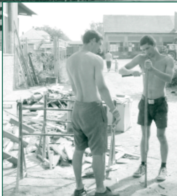
Po povodních v roce 2002 jsme z pole Kosa odstranili hory naplaveného písku.

Uvítáme finanční podporu, věcné dary, sponzorské služby, manuální výpomoc – pomoci může opravdu každý!