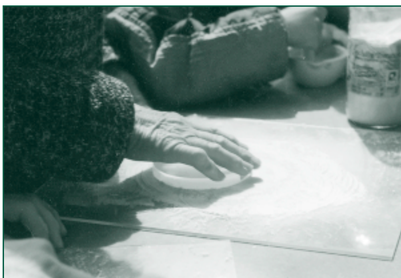
Příprava křemenného biodynamického preparátu

řada kritérií. Srovnání poskytuje švýcarský polní pokus DOK v němž jsou v Oberwilu od roku 1978 zkoumány tři systémy pěstování plodin: biologicko-dynamický (D), ekologický (O) a konvenční (K), vedle nich i kontrolní varianta. Pokus provádí Výzkumný ústav ekologického zemědělství ve Fricku (Švýcarsko). Srovnáván je nejen výnos, ale i vliv metody na ekosystém a také na kvalitu sklizených produktů.