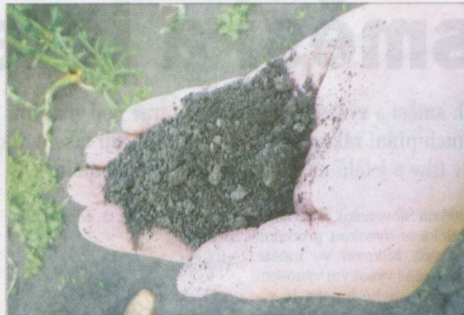
Péče o půdu a stálé sledování její kvality je předpokladem úspěšného ekologického hospodaření

Používání i povolených hnojiv je možné pouze tehdy, byly-li vyčerpány všechny možnosti v podpoře půdní úrodnosti a výživy rostlin uvnitř podniku (např. osevní postupy, pěstování leguminóz, zelené hnojení a vlastní statková hnojiva z EZ). Obecně platí, že se