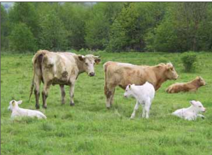
Posunutím pastvy dobytka na začátek srpna se může zajistit úspěšné hnízdění ptáků na pastvině.