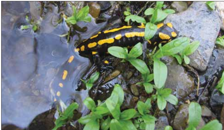
Mlok skvrnitý – upřednostňuje listnaté nebo smíšené lesy v pramenných oblastech s kamenitými svahy. Zimuje ve skalních štěrbinách, štolách, mezi kameny.

Základem ochrany obojživelníků je péče o přirozené a málo narušené biotopy a ekosystémy vhodné pro jejich vývoj a život. Je nut-