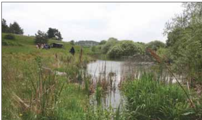
Základem ochrany obojživelníků je péče o přirozené a málo narušené biotopy a ekosystémy

Máte-li v plánu stavbu nové vodní nádrže, pamatujte na to, že pro obojživelníky jsou nejvhodnější vodní plochy s členitými břehy a různou hloub-