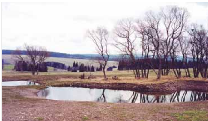
Jezírka v Orlickém Záhoří