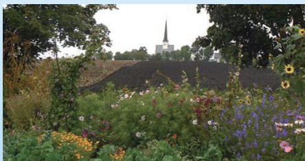
Kvetoucí biopásy vysévané mezi zemědělskými plodinami zvyšují estetiku okolí farmy a rozšiřují potravní nabídku pro volně žijící živočichy.

lu farmy. Chovají 18 dojných krav, 30 jalovic, 40 slepic a tři prasata. Trygve je hrdý na to, že je soběstačný v produkci krmiv pro svá hospodářská zvířata. Mimo krmiv pěstuje pro potravinářské účely pšenici, ječmen, žito a další plodiny jako brambory či zeleninu (mrkev, celer, pórek, cibuli, tuřín), které prodává spolu s mlékem a masem do obchodních řetězců. Pro hnojení používají vlastní kompostovaný hnůj, močůvku ředěnou