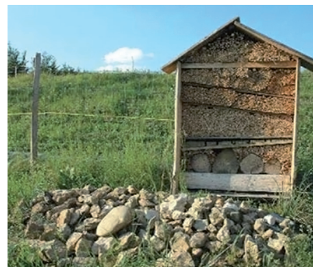
Úl z nařezaných bezových prutů slouží jako útočiště pro množství opylovačů, hromada kamení je rezervoárem drobných živočichů (hmyz, ještěrky, drobní savci aj.). Ekologický třešňový sad, Švýcarsko

Udržování rozmanitosti v rámci jednoho druhu spočívá zejména v aktivní údržbě genetických zdrojů. Z tohoto pohledu je v ekologickém zemědělství v porovnání s konvenčním zaznamenáno pěstování většího množství krajových lokálních odrůd plodin, v chovech nalezneme více původních plemen domácích zvířat. Na stoupající spotřebitelský zájem o mizející staré krajové odrůdy ovoce a zeleniny reagují právě ekozemědělci a pro