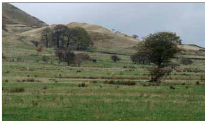
Problém zde způsobují pouze tzv. pastevní plevele

Farma je dosud zařazena v jednom z dřívějších režimů opatření tzv. Countryside Stewardship Scheme (CSS). Protože ale část pozemků spadá do území národního parku, plní již nyní vyšší podmínky ochrany přírody (např. žádné hnojení průmyslovými hnojivy, omezení zatížení pastviny ve vyšších vřesovištních polohách, kdy na jednu ovci připadá 0,8 ha), chystá se po ukončení CSS přejít do režimu Higher Level