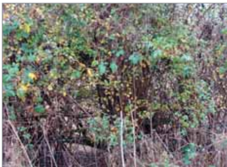
Malé výhonky lísky obecné ( Corylus avellana ) jsou v živých plotech ohýbány a proplétány mezi ostatní keře

I Obnova a údržba tradičních živých plotů , které mohou být zastříhávány v různých periodách. Přitom platí – čím méně, tím lépe (nejvyšší platba je při zastřížení dvakrát za pět let). Při jejich zakládání se hojně používá opět líska, jejíž mladé výhonky jsou ohýbány a proplétány mezi ostatní keře; společně vytvářejí přirozené ohraničení pastvin a zároveň slouží jako