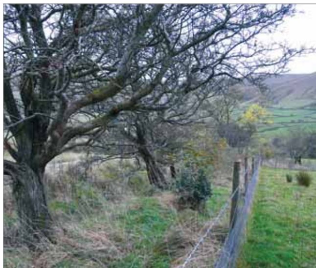
Oplocení vodního toku je jedním z opatření AEO, kterým farmář může zvýšit druhovou biodiverzitu na farmě

Bratři Websterovi obhospodařují 111 ha heterogenní půdy (od těžkých jílu po lehké písčité půdy). Farma se nachází v nadmoř-