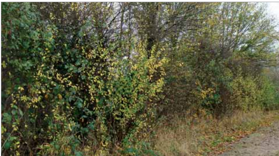
Kout pozemku ponechaný ladem – „field corner“

Vaše názory a připomínky na: marketa.sablikova@bioinstitut.cz nebo tel.: 585 631 178