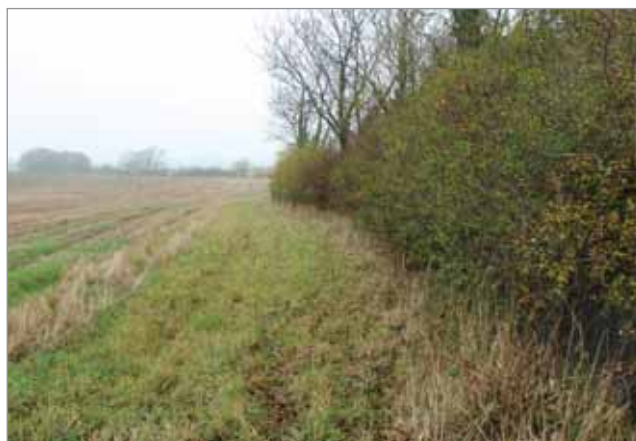
Zatravněné okraje polí a pastvin je potřeba udržovat bez postřiků, bez hnojení a nepřepásané

Zatravněné okraje polí a pastvin , tzv. margins, jsou travnaté pásy o šířce 2, 4, 6 až 12 m, které je potřeba udržovat bez postřiků, hnojení a v případě pastvin nepřepásat. Závazek je desetiletý. Klíčem pro volbu šířky zatravněného okraje je dohoda s farmářem, při jeho volbě platí podmínka, že pás nezabere více než 10 % z výměry půdního