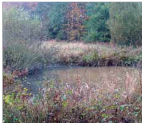
Péče o maloplošné mokřady na zemědělské půdě

Bioinstitut, o.p.s., Mendelova univerzita v Brně a Agritec, s.r.o. si Vás dovolují pozvat na seminář