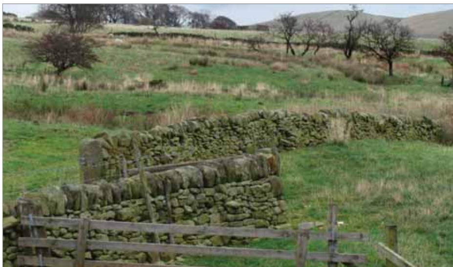
Tradiční anglické živé ploty jsou v této oblasti nahrazeny kamennými zídkami