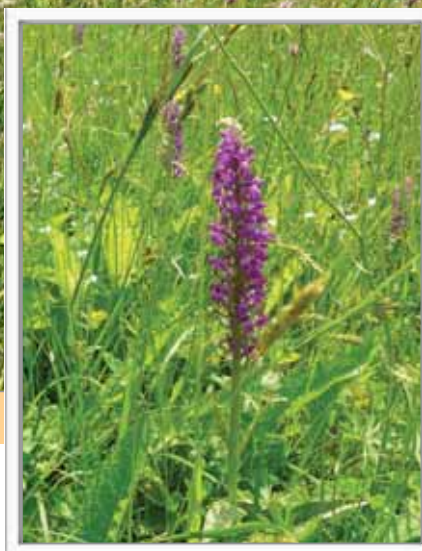
Prstnatec májový ( Dactylorhiza majalis )

● Pro potřebu sdílet s místními obyvateli vztah k obci zapisováním historického vývoje jednotlivých osad (řada z nich byla vydána ve Starohamerském zpravodaji).