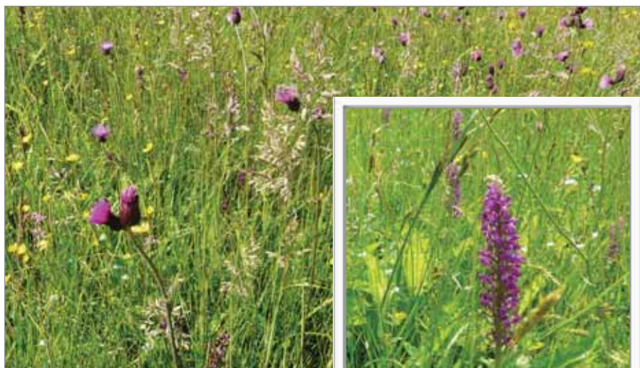
Vlhká vrchovištní louka

Z živočichů zde byly zaznamenány běžnější druhy. Z obojživelníků se vyskytuje např. skokan hnědý ( Rana temporaria ), z plazů ještěrka živorodá ( Zootoca vivipara ), vzácně zmije obecná ( Vipera berus ). Na dalších pastvinách zaznamenáme např. výskyt hořce tolitovitého ( Gentiana asclepiadea ). Na velké části luk a pastvin v jarním období běžně rostou chráněné druhy jako prstnatec májový ( Dactylorhiza majalis ), kýchavice Lobelova ( Veratrum lobelianum ), kamzičník rakouský ( Doronicum austriacum ), vemeník dvoulístý ( Plantanthera bifolia ) aj. Jen na malé části TTP zaznamenáme ruderalizovaná a degradovaná společenstva. (sč)