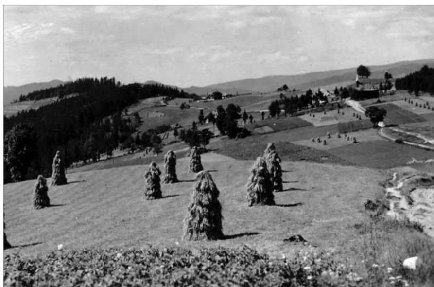
Louky s tradičními sušáky na Gruni, historický snímek rázu zdejší krajiny