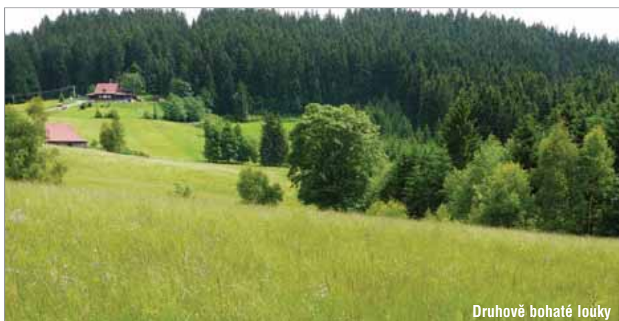
Druhově bohaté louky

● Pro zásadu, že je třeba věnovat se vlastním lidem – je jasné, že tam, kde se dobře bydlí, líbí se i turistům.