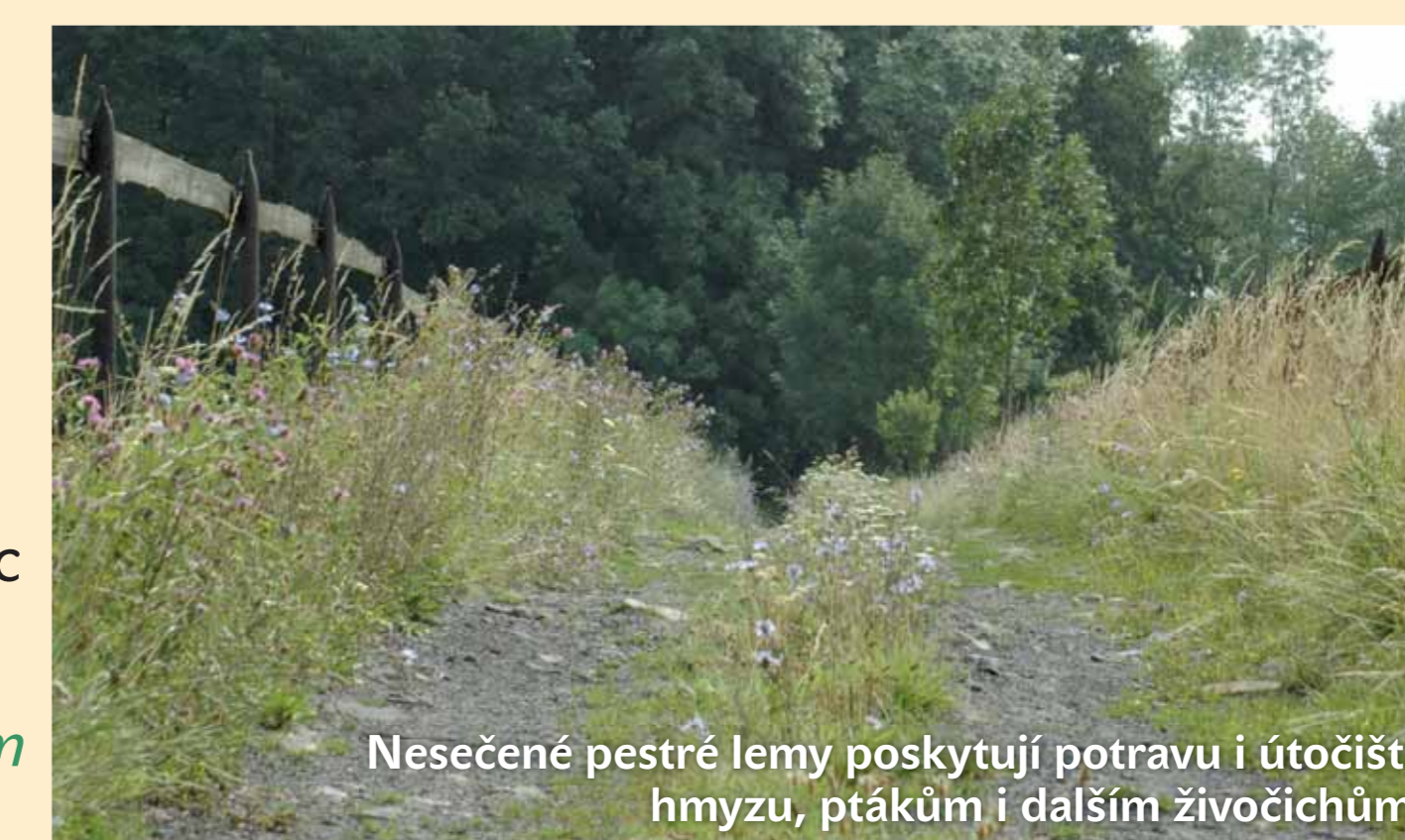
Nesečené pestré lemy poskytují potravu i útočiště hmyzu, ptákům i dalším živočichům.