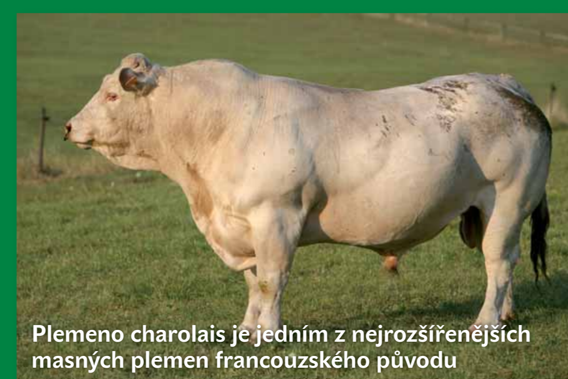
Plemeno charolais je jedním z nejrozšířenějších masných plemen francouzského původu