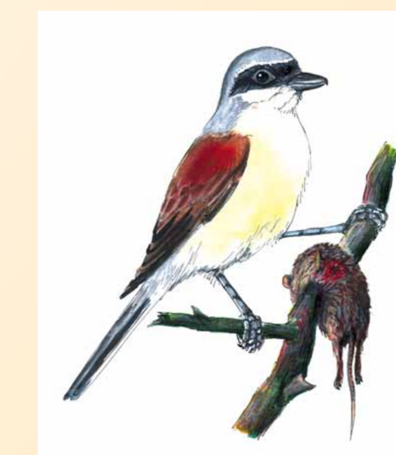
Ťuhák obecný Lanius collurio – prospívá v křovinaté krajině s poli a hustými trnitými keři