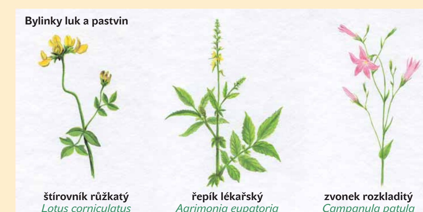
Bylinky luk a pastvin štirovník růžkatý Lotus corniculatus řepík lékařský Agrimonia eupatoria zvonek rozkladitý Campanula patula

V travních porostech zcela převažují mezofilní typy ovsíkových lučních porostů Arrhenatherion s druhy jako ovsík vyvýšený Arrhenatherum elatius , zvonek rozkladitý Campanula patula , kopretina bílá Leucanthemum vulgare . Na mírných jižních svazích vidíte mezernaté širokolisté suché trávníky Bromion erecti s teplomilnými a suchomilnými druhy jako pryskyřník mnohokvětý Ranunculus polyanthemos , řepík lékařský Agrimonia eupatoria , čičorka pestrá Coronilla varia , chrpa čekánek Centaurea scabiosa a v nivě horního toku potoka Rakovec najdete zachovalé fragmenty vlhkých pcháčových luk Calthion provázené pcháčem zelinným Cirsium oleraceum a pcháčem potočným Cirsium rivulare .