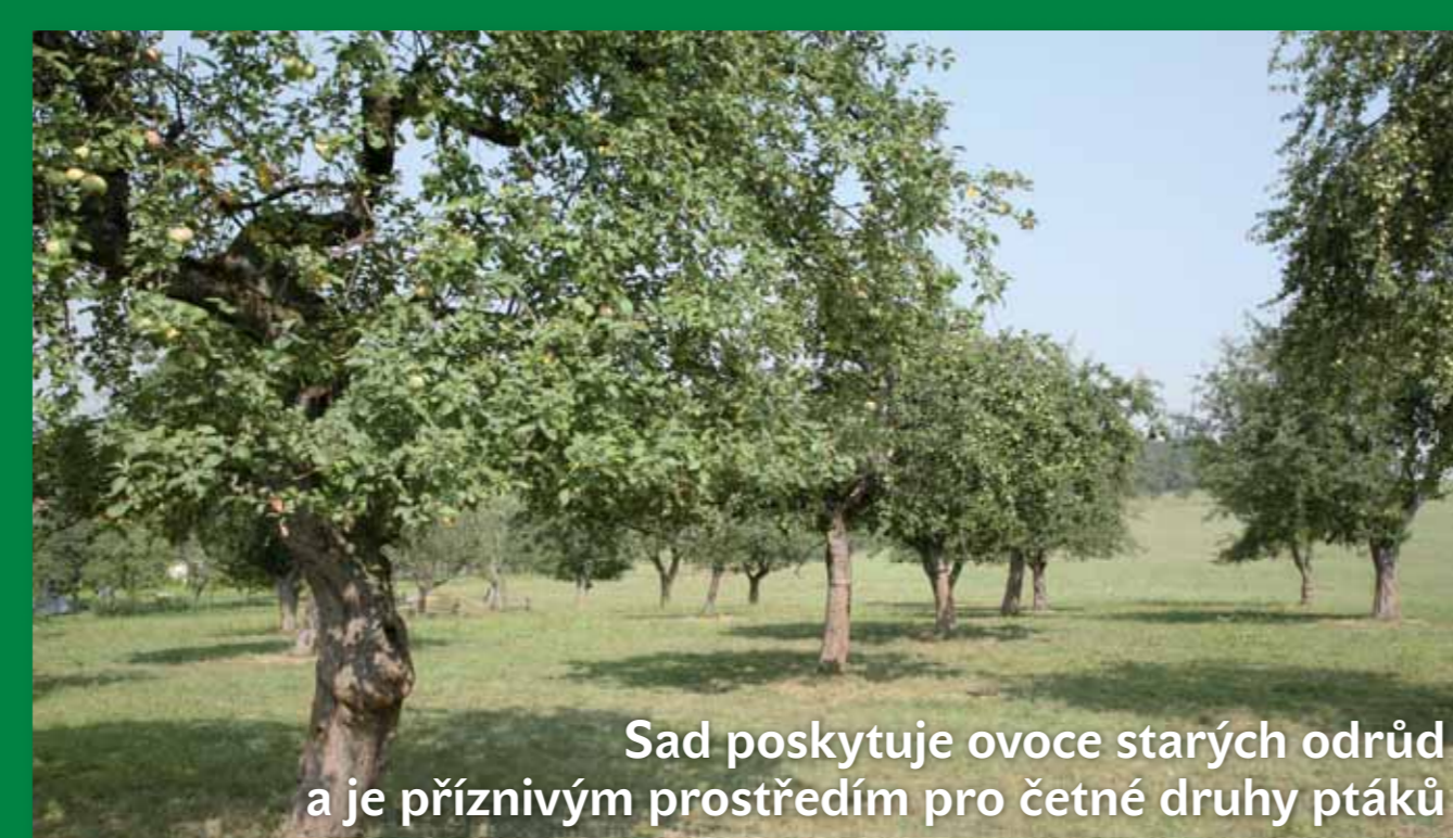
Sad poskytuje ovoce starých odrůd a je příznivým prostředím pro četné druhy ptáků