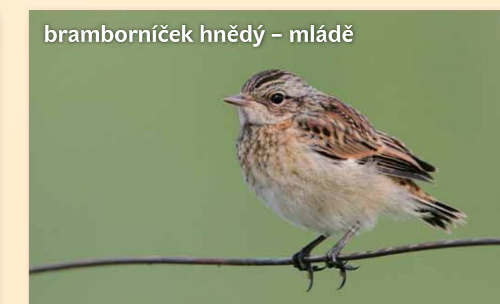
bramborníček hnědý – mládě